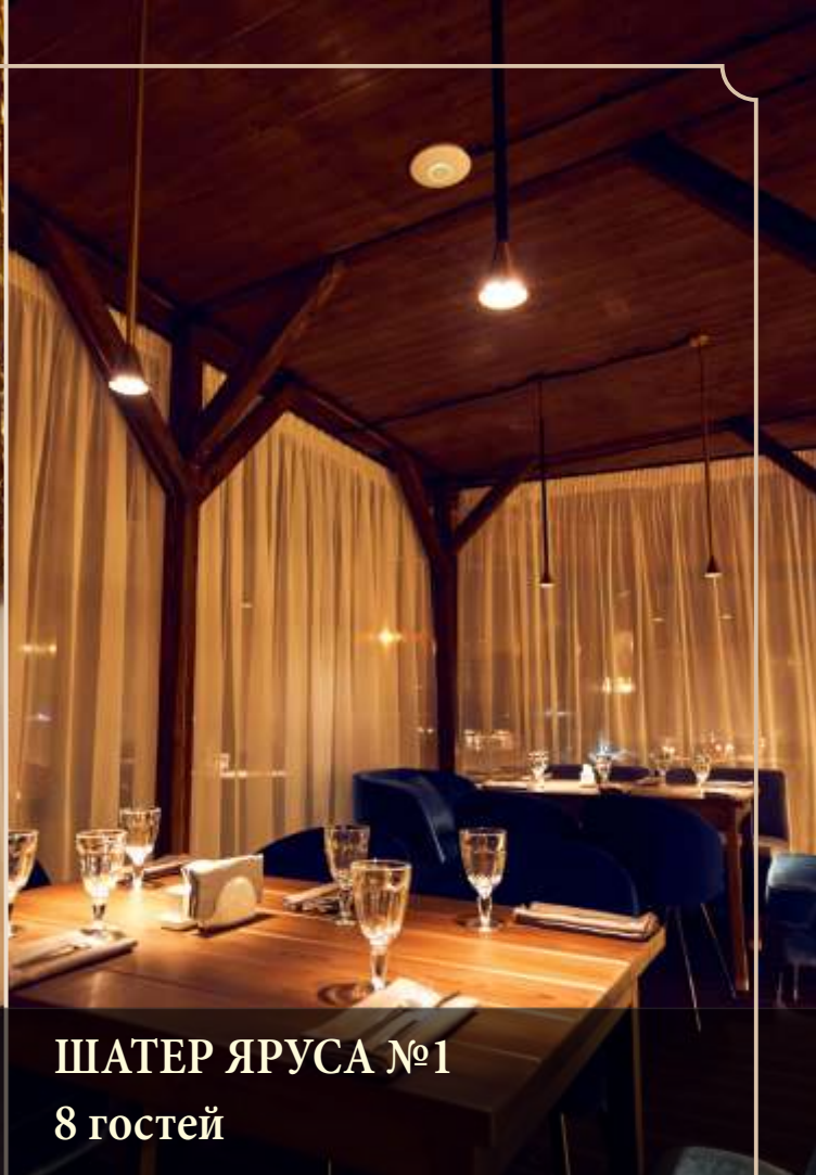
ШАТЕР ЯРУСА №1 8 гостей