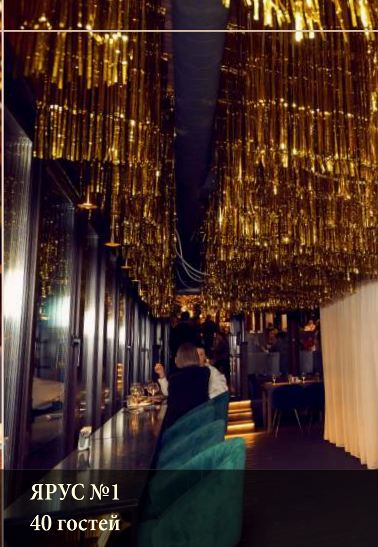
ЯРУС №1 40 гостей