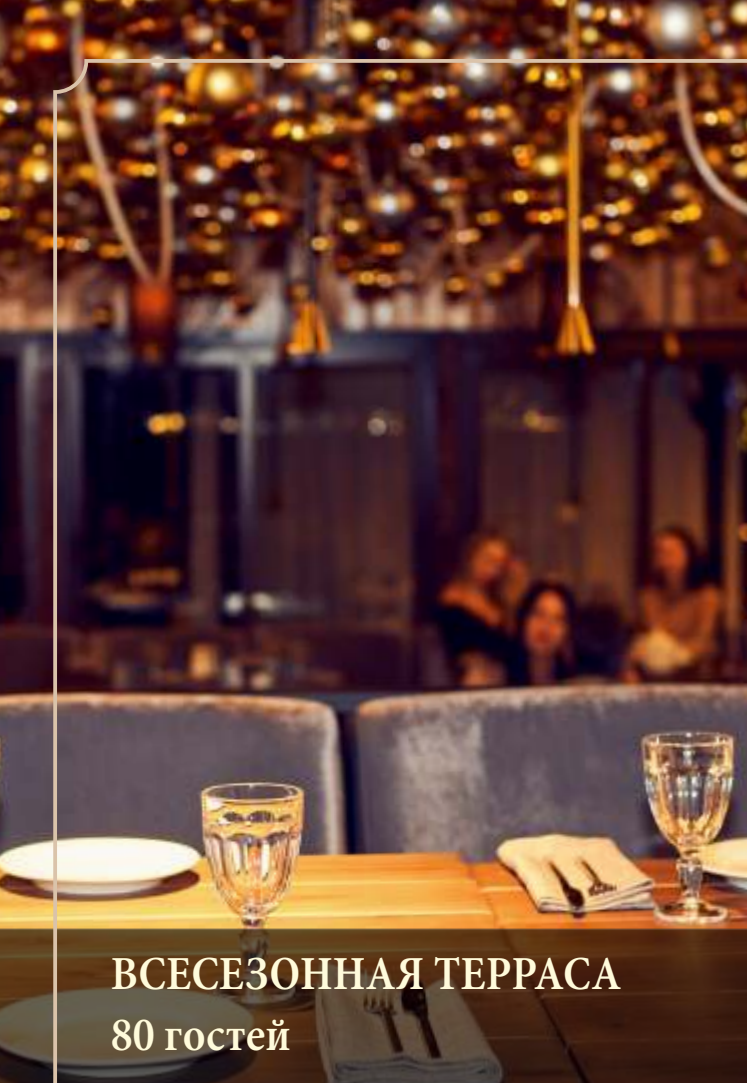
ВСЕСЕЗОННАЯ ТЕРРАСА 80 гостей